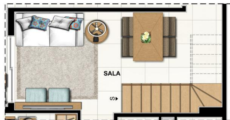
ALTERAÇÃO PARA OS APARTAMENTOS 701 E 702