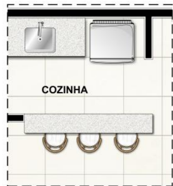
OPÇÃO COZINHA AMERICA